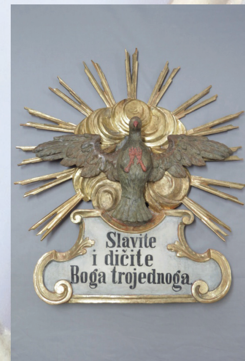
Slika 2. Duh Sveti s kartušom, oblacima i zrakama, nakon konzervatorsko-restauratorskih radova