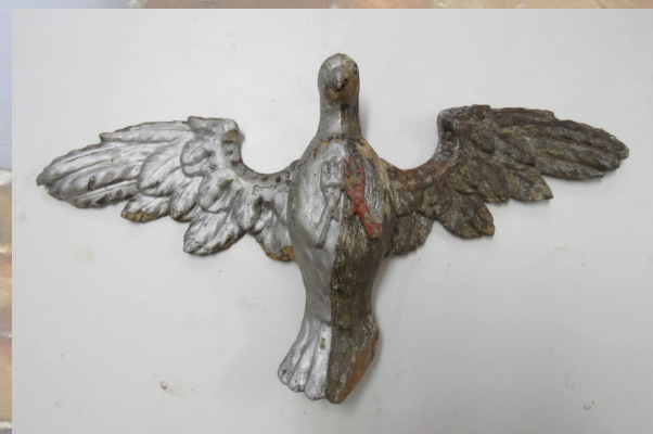
Slika 5. Duh Sveti, tijekom uklanjanja preslika