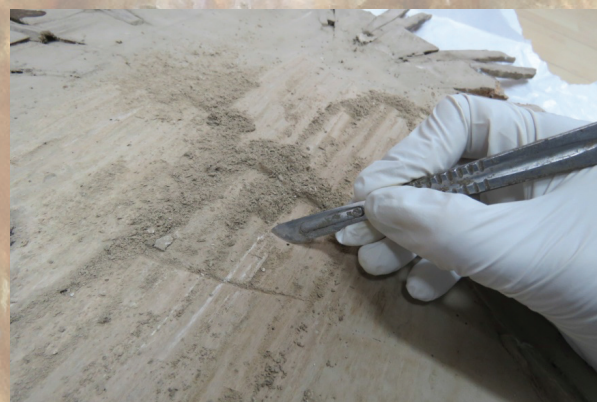
Slika 4. Čišćenje poledine mehanički skalpelom