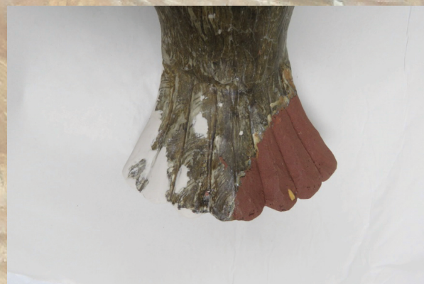
Slika 6. Rekonstrukcija u sloju nosioca i osnove