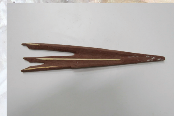
Slika 8. Rekonstrukcija zrake u Araldithu, nakon obrade dlijetom