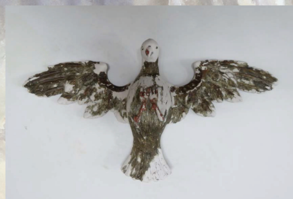
Slika 7. Duh Sveti, nakon rekonstrukcije u sloju osnove