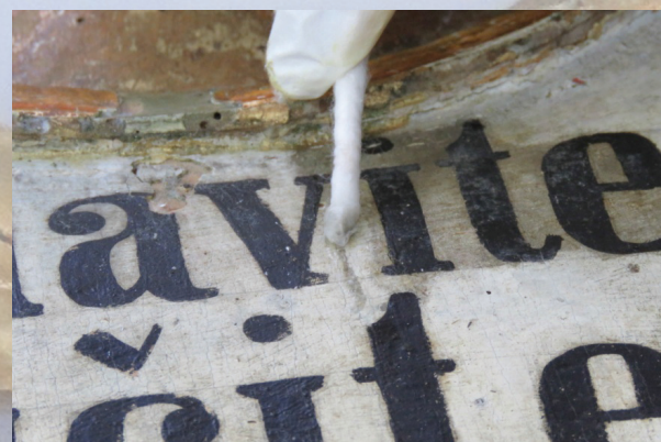
Slika 3. Uklanjanje površinske prljavštine s kartuše