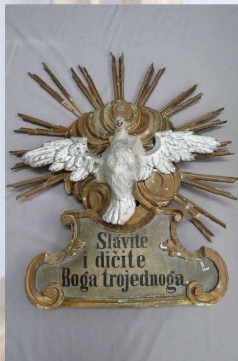
Slika 1. Duh Sveti s kartušom, oblacima i zrakama, prije konzervatorsko-restauratorskih radova