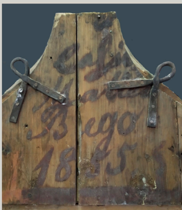
Potpis autora na poleđini oltara