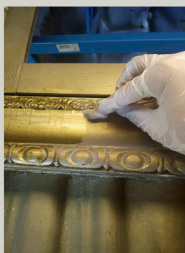
Uklanjanje površinske nečistoće