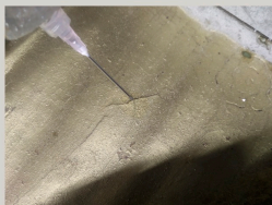
Stabilizacija slikanog sloja