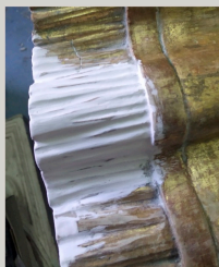
Rekonstrukcija nedostajućih dijelova